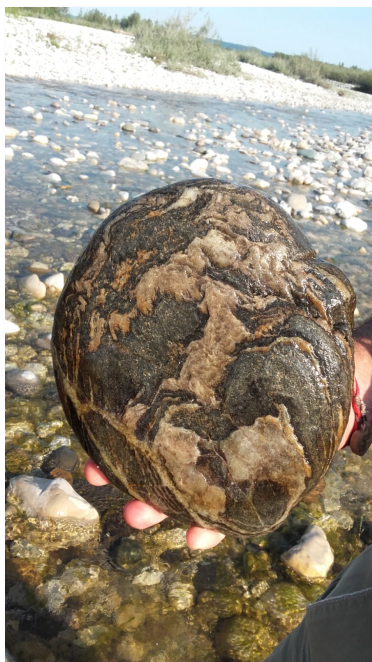
Dimensioni 180x30xh 250

Al tramonto di una giornata interminabile stanchi e arrossati sulla via del ritorno... eccola!!